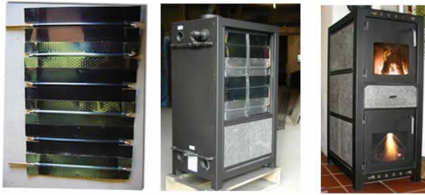
Vandharpe → Placeres under stenkledning → Ikke synligt