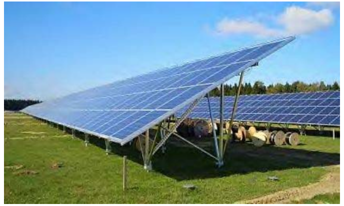
2.5 Megawatts Installed in Pocking.

Shell Solar reports that progress has been made with the construction of the 10 Megawatt solar power plant at a former military area near Pocking, Bavaria. A quarter of the solar panels and three quarters of the mounting systems have now been installed.