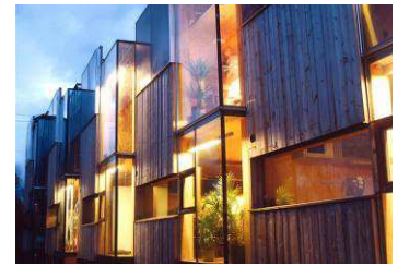
Bilde: Solfangere i Tromsø 2

Et solvarmeanlegg kan dekke minst 30 % av varmebehovet og 50 % av varmtvannsforbruket i en norsk bolig. Bruk av solvarme er mest lønnsomt for bygg som har et høyt varmebehov om sommeren. Allikevel leverer ikke solfangerne varme bare om sommeren, men også når det er kald temperatur ute. Prisen for denne varmen er typisk fra 60 øre/kWh for en enebolig 1 . For større varmebrukere med stort varmeforbruk i sommerhalvåret reduseres denne prisen.